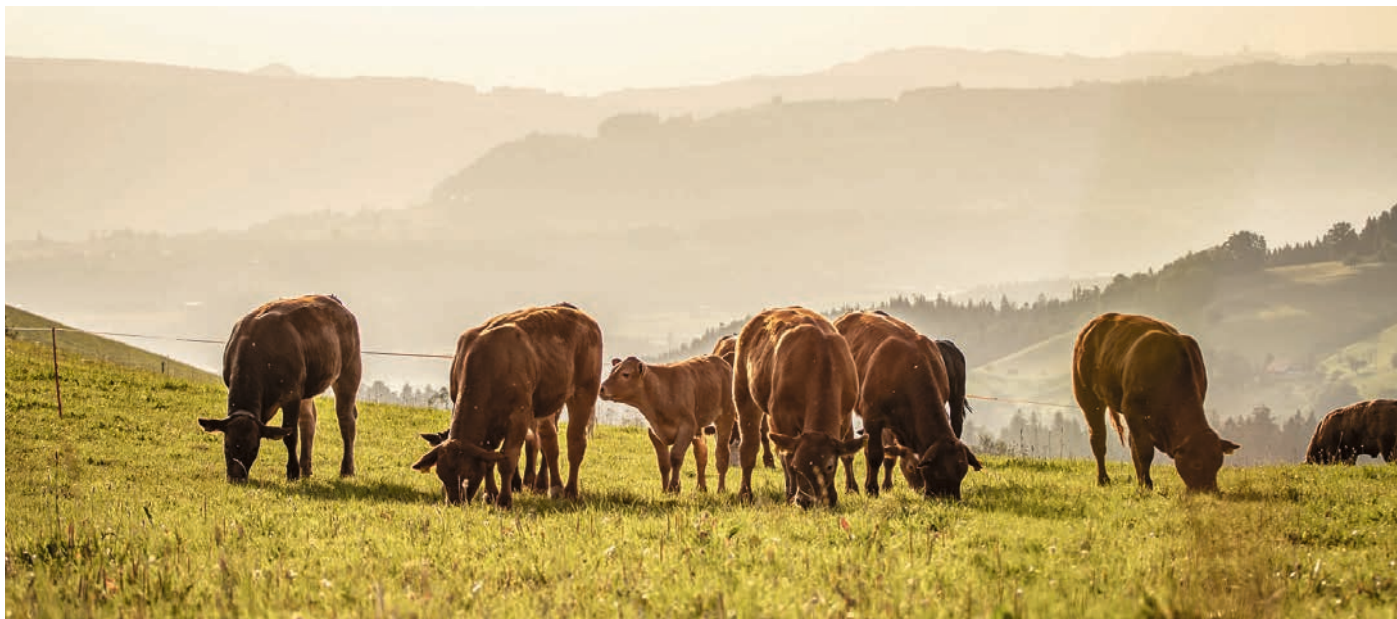
L'atténuation des fluctuations saisonnières du Natura-Beef au 3 e trimestre est en bonne voie.

Naturafarm Bœuf de pâturage. Grâce aux réseaux (sociaux) et au soutien des membres qui avaient déjà réalisé des expériences positives, nous avons pu gagner de nouveaux fournisseurs. En 2026, l'accent sera mis sur le développement des quantités et des exploitations. Pour savoir dans quelle mesure Naturafarm Bœuf de pâturage augmente parfaitement la perméabilité des labels de Vache mère Suisse, rendez-vous à la page 6.