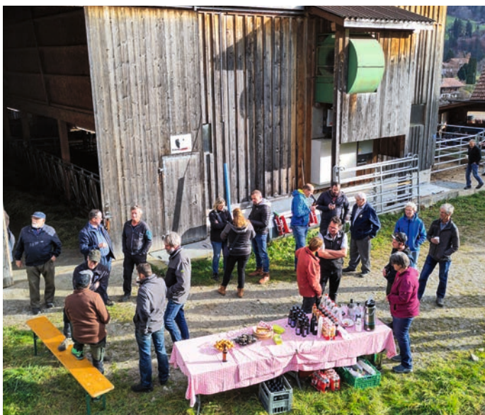
Les séminaires de Vache mère Suisse sont importants pour favoriser les échanges entre les membres et les discussions sur des thèmes d'actualité.

La collaboration avec Bœuf de pâturage bio constitue un nouveau domaine d'activité. Depuis 2024, Vache mère Suisse était responsable par mandat de la gestion administrative de la CI Bœuf de pâturage bio. En 2025, Migros a décidé de lui confier la responsabilité de la directive Bœuf de pâturage bio à partir du 1 er janvier 2026. Vache mère Suisse veut à l'avenir défendre et promouvoir l'élevage de bœufs de pâturage en plus de celui des vaches allaitantes. Cette collaboration doit permettre d'exploiter les synergies et de mieux défendre la production de viande bovine basée sur les herbages. L'élevage allaitant et celui de bœufs de pâturage correspondent à la vision du Conseil fédéral pour l'agriculture suisse en 2050.