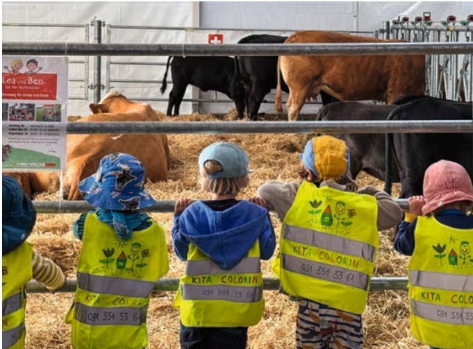
Des vaches allaitantes à la BEA de Berne.

échanges authentiques et à une compréhension mutuelle entre le monde agricole et la société.