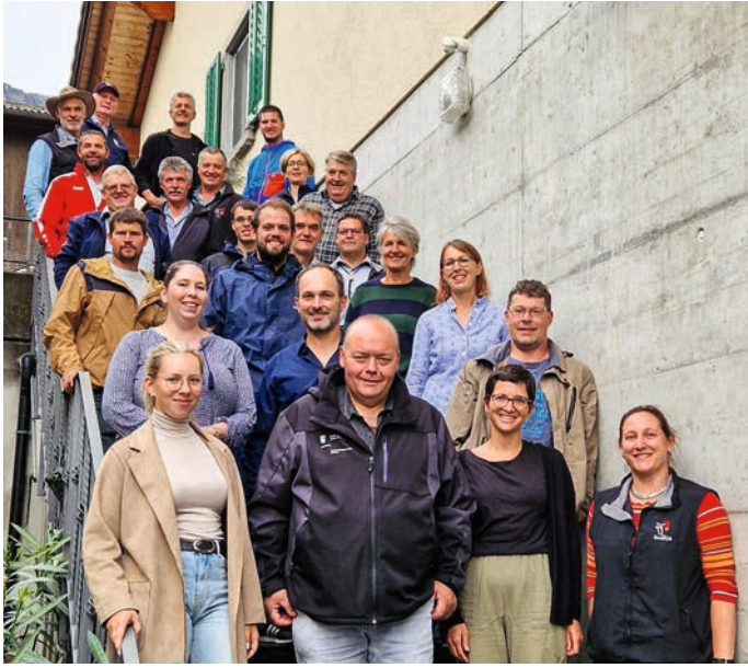
L'équipe d'expert-es lors du cours pour expert-es 2025 au Plantahof de Landquart.

choix de taureaux d'élevage a été présenté, les jeunes sujets comme les plus âgés ayant leur plateforme. Avec les races Angus, Aubrac, Brune originale, Charolaise, Dexter, Grise, Highland Cattle, Hinterwald, Limousine, Speckle Park, Simmental et Zébu, il y avait une magnifique collection à admirer.