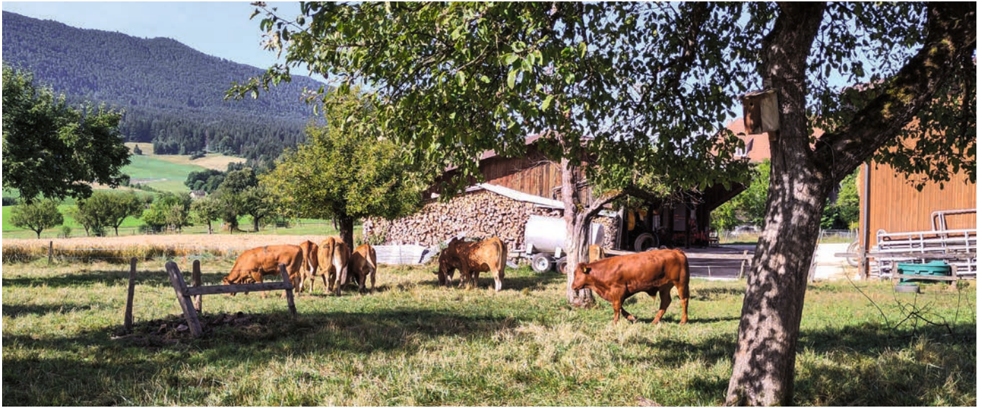
Des animaux Naturafarm Bœuf de Pâturage au pâturage à Pontenet en été 2025

soit vendu à une exploitation spécialisée dans l'engraissement qui achètent des remotes nées sur des exploitations allaitantes reconnues.