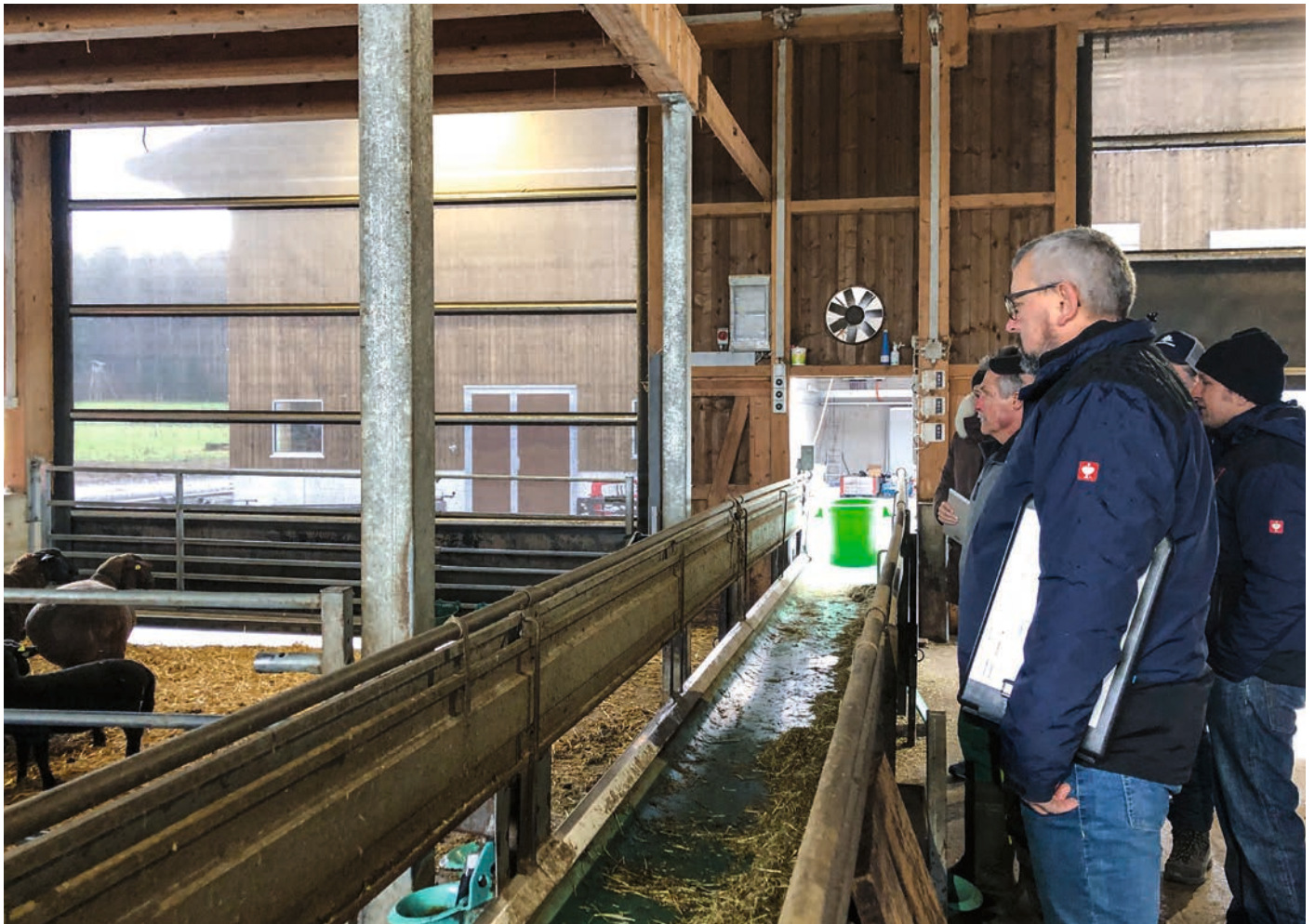
Durant l'hiver 2024-2025, un petit groupe d'inspecteurs a été formé aux contrôles des élevages d'ovins pour AQ-Viande Suisse.

de l'évaluation des risques ainsi que la prise en compte sur BeefNet de données provenant de « Mon partage de données agricoles » ou d'agridata.ch devraient, à l'avenir, profiter davantage aux exploitant·es qui gèrent leur exploitation de manière transparente et exemplaire.