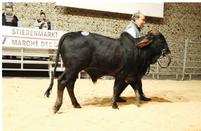
Une race rare – Zébu – présentée lors de la célébration du 100 e marché des taureaux.

En janvier 2025 a eu lieu la célébration du 100 e marché des taureaux. Elle s'est tenue à l'occasion du marché des taureaux des 15 et 16 janvier 2025. Les exploitations d'élevage ayant vendu le plus de taureaux sur les marchés de Vache mère Suisse depuis leurs débuts ont notamment été récompensées. De même, un grand