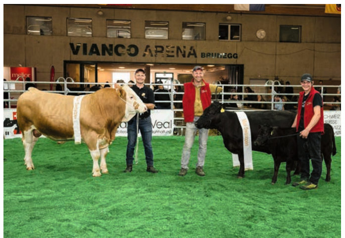
Miss et Mister Swissopen 2025.