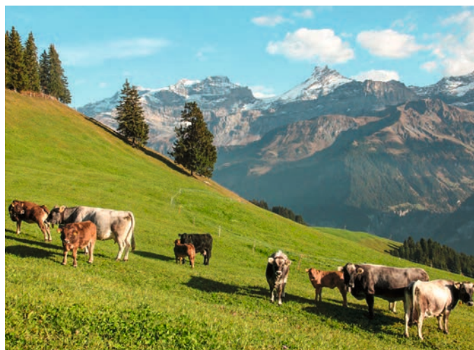
Les troupeaux allaitants aident au maintien de prairies et de pâturages ouverts. Ils entretiennent le paysage et favorisent la biodiversité.

de la viande sur des prairies et des pâturages qui, sans animaux de rente, ne pourraient pas être utilisés pour la production alimentaire. Il contribue à l’approvisionnement de la population tout en réalisant des recettes. En Suisse, l’élevage allaitant gagne en importance pour préserver le paysage rural et les ressources naturelles, et ces prestations supplémentaires nécessitent des paiements directs. Si les herbages n’étaient plus exploités, près d’un million d’hectares de surfaces agricoles et alpêtres et une grande part de biodiversité seraient perdus. La part des vaches allaitantes est plus élevée en région de montagne qu’en région de plaine et représente même 36 % en zone de montagne 4. L’élevage allaitant offre des perspectives aux familles paysannes et contribue à l’occupation décentralisée du territoire.