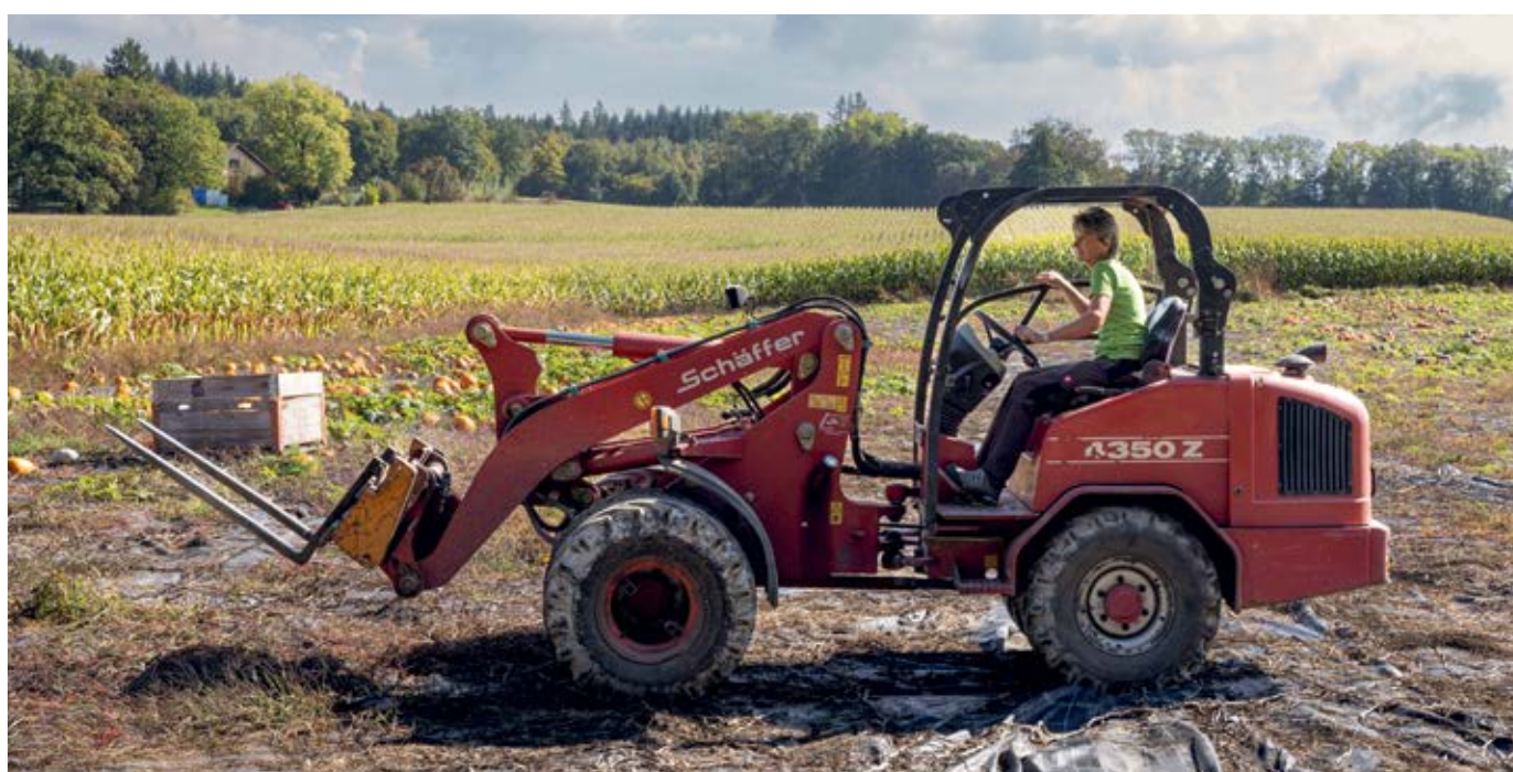
Aujourd'hui, la position des femmes dans l'agriculture est bien établie. Toutefois, cette évolution positive ne doit pas masquer les défis importants qui subsistent.

Percée majeure sur le front des paiements directs : selon la nouvelle ordonnance qui entrera en vigueur en 2027, les exploitations ne percevront l'intégralité des paiements directs que si les conjoint·es et partenaires enregistrés y travaillant disposent d'une couverture d'assurance personnelle. Pour l'USPF, il s'agit d'une avancée concrète après des années de mobilisation. Mais la bataille est loin d'être terminée : si la réglementation actuelle protège les femmes en cas de maladie, d'accident, d'invalidité ou de décès, elle ne garantit ni une rémunération équitable ni une prévoyance vieillesse suffisante. Ce n'est donc qu'une première victoire, et l'USPF continuera de lutter pour des conditions financières claires, des flux d'argent transparents et des conseils globaux pour les couples, par exemple lors de la reprise d'une ferme, d'investissements ou de la planification de la succession.