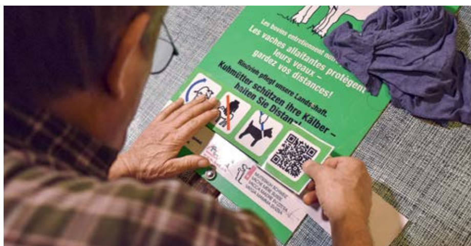
Pour compléter les panneaux d'avertissement « Les vaches allaitantes protègent leurs veaux », l'autocollant avec pictogrammes et code QR est disponible auprès du SPAA.

En cas d'accident, il faut immédiatement alerter les services de secours si nécessaire. Il est également recommandé de faire appel au service cantonal de vulgarisation agricole, à la représentation régionale de Vache mère Suisse ou au SPAA, qui sont en contact étroit et ont l'expérience de la gestion des accidents.