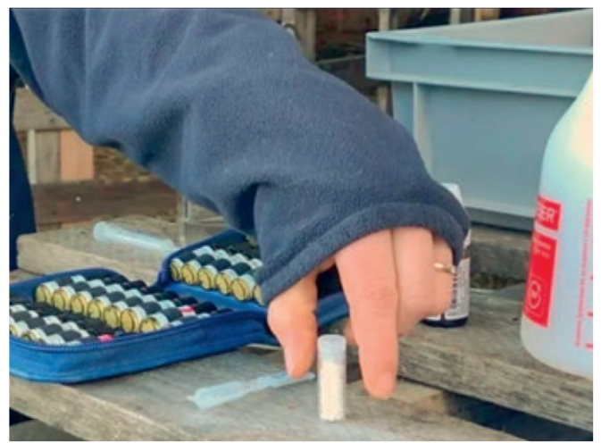
Certaines règles doivent être respectées lors du mélange des granules.