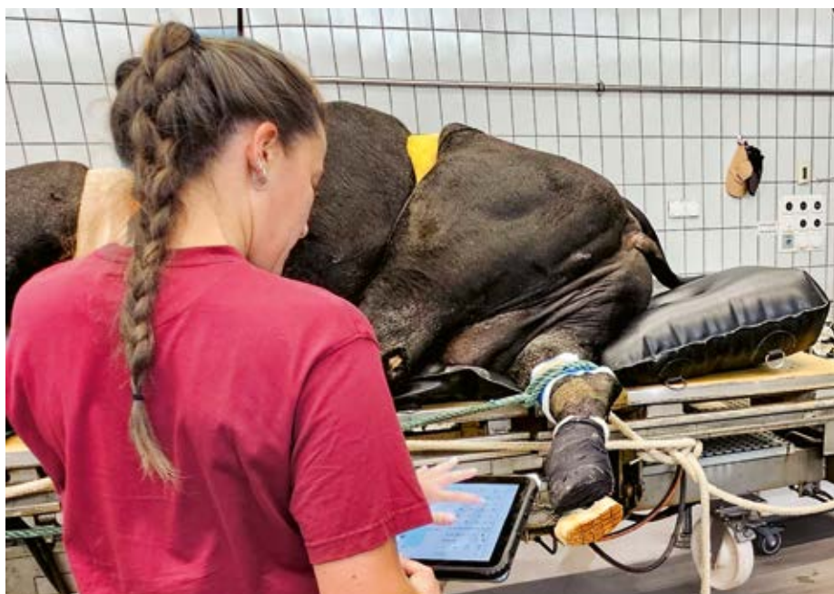
Faites enregistrer numériquement les résultats pendant le parage des onglons. Cela en vaut la peine.

Comme chaque exploitation est différente s'agissant du mode de garde, de la race, de l'alimentation et de nombreux autres facteurs, il est difficile de donner une recommandation uniforme. En principe, il s'avère toutefois que le parage des onglons devrait avoir lieu au moins deux fois par an. Selon les exploitations, trois parages par an peuvent être nécessaires. Comme la nécessité d'un parage ne dépend pas uniquement de facteurs liés à l'exploitation, mais que chaque animal a des besoins légèrement différents, il peut également être judicieux d'effectuer le parage du troupeau deux fois par an et d'emmener les vaches à problèmes, les animaux plus âgés ou les taureaux d'élevage lourds une fois de plus au congrain pour les contrôler entre-deux. Les vaches qui ont déjà souffert d'affections graves des onglons et les vaches âgées ont un risque accru de maladies, telles que les ulcères ou le décollement de la muraille. De telles affections sont souvent accompagnées de boiteries et de douleurs et sont également importantes sur le plan économique, car les vaches boiteuses mangent moins, sont