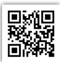
Mehr zur TVD-App mit Videos

Um diese Funktion zu nutzen, muss die abmeldende Tierhalterin das Begleitdokument elektronisch ausstellen (siehe blaue Umrandung «TVD-App Übersicht») und den von der App erstellten QR-Code abrufen. Der Empfänger andererseits kann dann den QR-Code mit der TVD-App scannen (siehe gelbe Umrandung ).