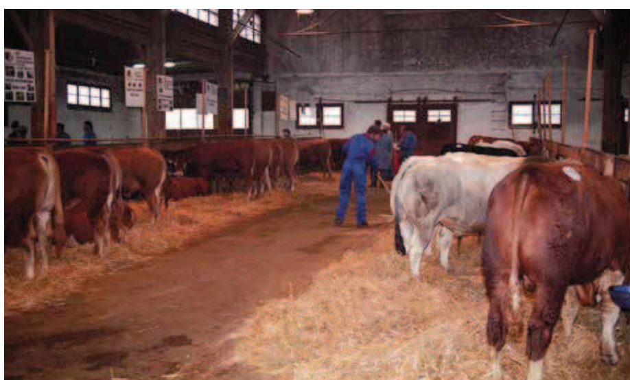
L'élevage des bovins à viande est adapté aux besoins des producteurs. Pendant longtemps, les taureaux F1 étaient répertoriés dans le herd-book. Comme le montre la photo prise dans les années 1990, l'élevage de taureaux de race est rapidement devenu populaire.