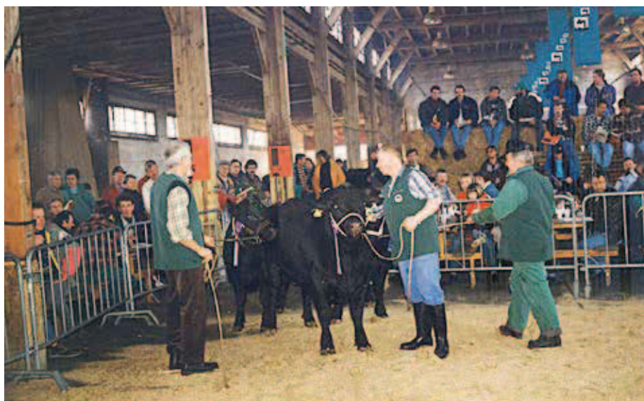
Les marchés des taureaux sont depuis toujours un indicateur de la qualité et des prix, ainsi qu'une plateforme de commercialisation au service des éleveurs et des acheteurs.

aux enchères a été organisée, si bien que le premier marché du printemps n'a accueilli que 14 sujets. Ces dernières années, 150 taureaux ont été présentés annuellement en moyenne.