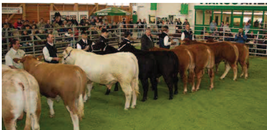
Le marché des taureaux du printemps 2005 dans la nouvelle Arena de Brunegg, dont la situation centrale et l'équipement fonctionnel sont un plus pour les marchés.

Réunions réservées à quelques initiés durant les premières années, les marchés des taureaux sont devenus des manifestations d'envergure nationale, à l'occasion desquelles on peut saluer régulièrement des visiteurs étrangers. Le premier marché des taureaux a été organisé en 1980 sur l'exploitation du domaine de Witzwil. Puis, après deux éditions dans le Seeland bernois, l'augmentation du nombre de taureaux présentés a incité Vache mère Suisse à déplacer la manifestation dans l'ancienne halle du marché de Brugg-Windisch, en Argovie. À cette époque, le marché avait lieu une fois par an, en octobre. Au début des années nonante, on y ajouta une deuxième édition. Depuis 2002, le marché a lieu trois fois par an.