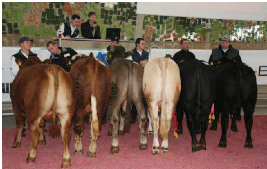
Depuis quelques années, on désigne des champions sur les marchés des taureaux.

Puis sont apparues la Charolaise, la Highland Cattle, la Blonde d'Aquitaine, la Galloway, la Piemontese, la Hereford, l'Aubrac, la Dexter, la Luing, la Pinzgauer et la Salers. Le herd-book des bovins à viande compte actuellement 32 races.