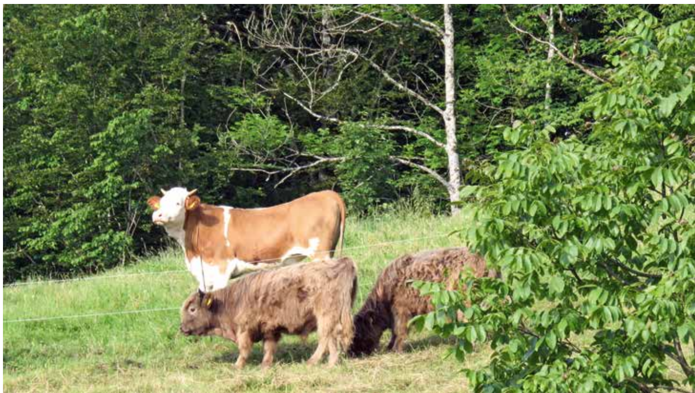
Les animaux de la race Highland (au premier plan) sont plus petits et se développent plus lentement que les races productives (en arrière-plan). Par contre, ils entretiennent les pâturages et favorisent la biodiversité.

Bien que la Highland choisisse des plantes fourragères de moindre qualité, c'est la seule race à avoir pris du poids sur les pâturages maigres des alpages concernés. À l'inverse, les vaches Brune originale ont perdu un peu de poids alors que les vaches Angus-Holstein ont eu une perte de poids importante. Plusieurs raisons expliquent cela. D'une part, les vaches spécialisées produisent plus de lait pour leurs veaux, mais si l'on additionne les changements de poids de la vache et du veau, les Highlands atteignent tout de même un accroissement supérieur. D'autre part, les Highlands économisent de l'énergie grâce à leur lenteur ainsi qu'à leur toison chaude et valorisent plus efficacement le fourrage grossier, si bien qu'elles ne doivent pas mobiliser leurs réserves malgré un régime plus maigre. Ces animaux ne sont pas concurrentiels sur des pâturages riches ou si des concentrés sont distribués, mais ils peuvent utiliser efficacement les zones marginales peu productives.