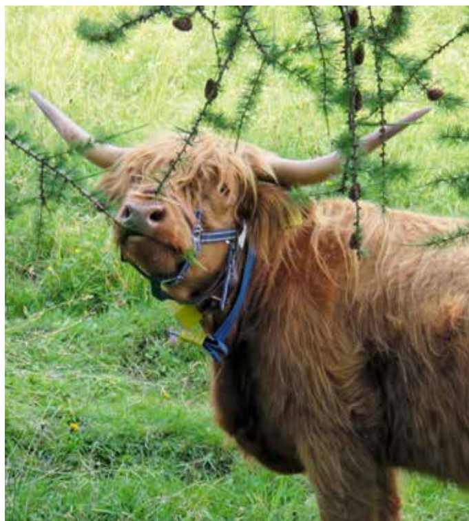
La Highland consommant aussi des plantes ligneuses, elle limite très efficacement l'embuissonnement.

Les essais ont montré que les bovins rustiques utilisent efficacement les pâturages maigres tout en favorisant la biodiversité. Pour les agricultrices et agriculteurs exploitant beaucoup de surfaces herbagères extensives et des zones marginales, ces animaux représentent une alternative digne d'intérêt par rapport aux races orientées vers la production. Le rendement des races rustiques étant plus faible que celui des races à viande spécialisées, une adaptation de la structure de l'exploitation et des débouchés est souvent nécessaire lors d'un changement de race. De nouvelles opportunités et de nouvelles branches de production peuvent cependant aussi apparaître. Les agricultrices et agriculteurs qui ne souhaitent pas renoncer à la race productive présente sur leur exploitation peuvent aussi