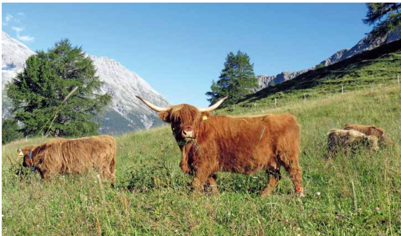
Les races de bovins rustiques, comme la Highland, se prêtent particulièrement bien à l'exploitation des zones marginales.

les races lourdes ne quittent pratiquement pas les terrains plats. Le piétinement déjà plus faible par le rapport poids/surface d'onglons de la Highland est donc réparti sur tout le pâturage. Le couvert végétal est ménagé, et le fourrage de l'ensemble de la surface mis à profit.