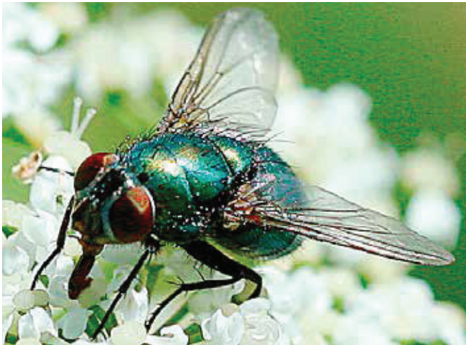
La mouche verte

Ulrich Jost* – Les températures remontent et nos animaux recherchent déjà souvent les zones ombragées du pâturage. Pour certains, la période des vélages est déjà derrière alors que pour d'autres elle sera bientôt d'actualité. Durant les périodes chaudes, une lourde menace pèse sur les veaux nouveau-nés : les mouches !