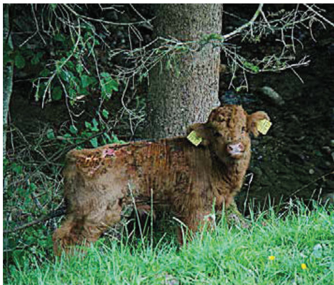
Ce veau a été tondu trois jours avant ces prises de vue et était fortement infesté de larves. Il a fallu recourir au vétérinaire pour soigner les plaies.

larves ont pu éclore des œufs, cela pourrait expliquer cet état. Les asticots commencent à se nourrir et peuvent littéralement dévorer l'animal par la peau, le nombril, l'anus ou le vagin. Si un animal est infesté de larves, il faudrait faire appel au vétérinaire