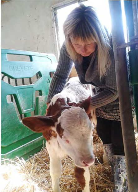
Reiki-Behandlung eines dehydrierten Kalbes