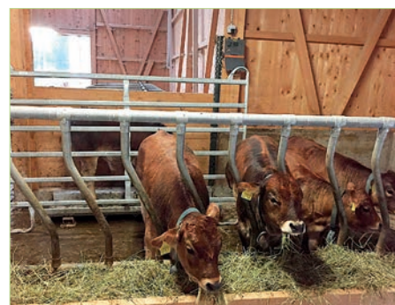
Balance pour veaux intégrée à l'écurie