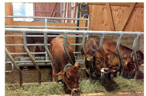
In den Stall integrierte Kälberwaage.