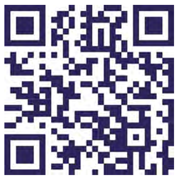
QR-Code pour App-Store / Google Play